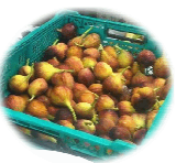
いちじくのイメージ

こちらで、加工品づくりをされているオカツ工房の皆さんと一緒に、いちじくを使ったジャム作り体験をします。