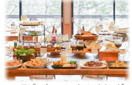
ラピュタファームのイメージ

川崎町にある地元で採れた新鮮野菜を使った約60品の手作り料理が並び果樹園の中のレストランです。