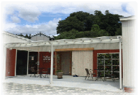
いとよーきたのイメージ