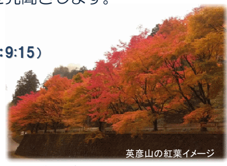
英彦山の紅葉イメージ

イベント企画：田川広域連携プロジェクト推進会議 (一社)田川広域観光協会、(一社)川崎町観光協会、NPO 法人九州地域交流推進協議会