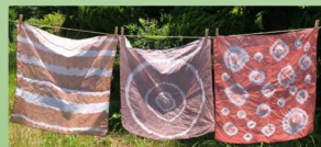
ハンカチの絞り染め体験