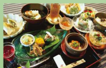
香春町の茅葺きの古民家・五吉庵で 頂く四季折々の小皿料理の昼食