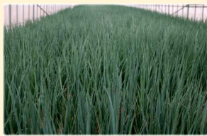
博多万能ねぎの産地見学